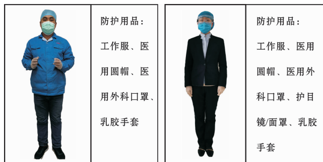
图5 适用于设备维修