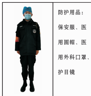
Fig 10 For waste disposal area