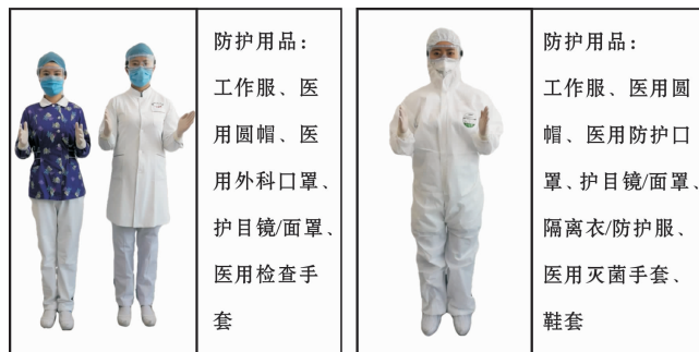
图1 适用于预检登记区、接诊分诊区、普通诊疗区、药剂师、影像检验技师