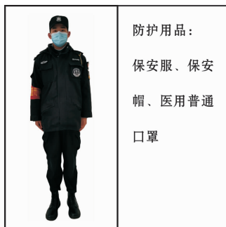
Fig 11 For thermometry area