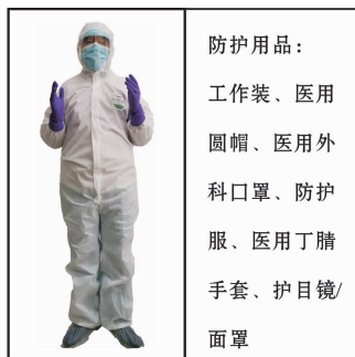
Fig 9 Applicable to diagnosis and treatment area

防护用品： 工作装、医用 圆帽、医用外 科口罩、防护 服、医用丁腈 手套、护目镜/ 面罩