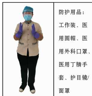
Fig 8 For public area

防护用品： 工作装、医 用圆帽、医 用外科口罩、 医用丁腈手 套、护目镜/ 面罩