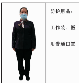
Fig 12 For public area