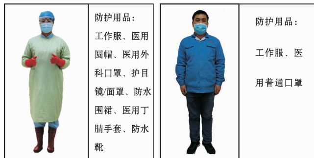
图3 适用于器械清洗区