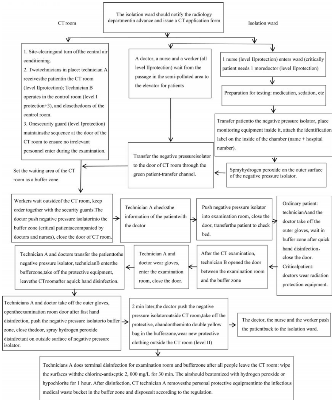
图2 疑似/确诊新型冠状病毒肺炎患儿CT转运流程