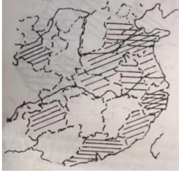
图 1 近 3000 年己巳己亥年疫病爆发地区预测图