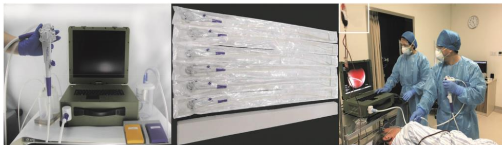
图 1 医用一次性便携式内镜系统 (YunSendo) 及操作过程

1.3 便携式一次性内镜系统 YunSendo 便携式一次性内镜系统 YunSendo 由解放军总医院全军消化内科研究所与惠州市先赞科技有限公司联合研发 (图 1), 包括电子内镜主机 (440mm×375mm×150mm, 展开后 440mm×375mm×375mm, 重量 13.7kg) 和一次性电子胃镜 (型号 XZING-W200B, 批号 W200B1812001)。该一次性内镜技术参数与目前主流胃镜相似, 向上角度 \geq 180^\circ , 向下、左、右角度 \geq 160^\circ 。目前不具备放大功能, 内镜钳道 3.0mm, 自带附送水装置, 可满足常规检查和治疗需求。前期应用实验猪模型证实该一次性内镜操作性能综合评分和上消化道病变检出率与奥林巴斯 GIF-Q260J 型胃镜无差异 (结果待发表)。该系统由交流电或自身携带的电池供电, 电池可持续工作 4h 或以上。本研究安装一次性胃镜, 采用直流电模式开启便携式主机, 系统显示运行正常, 满足检查全过程。